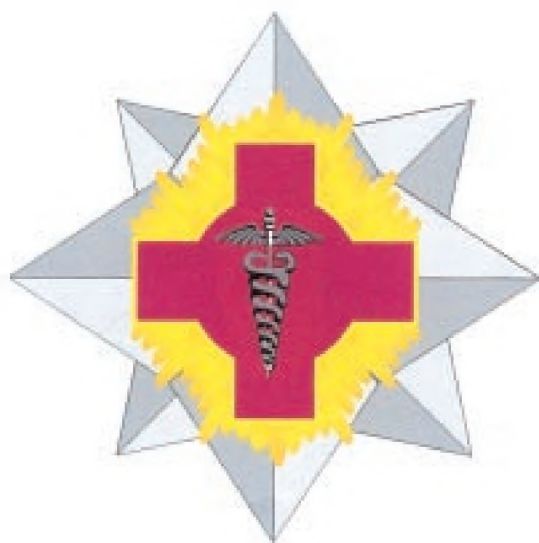
Placa gradului de Mare Ofițer