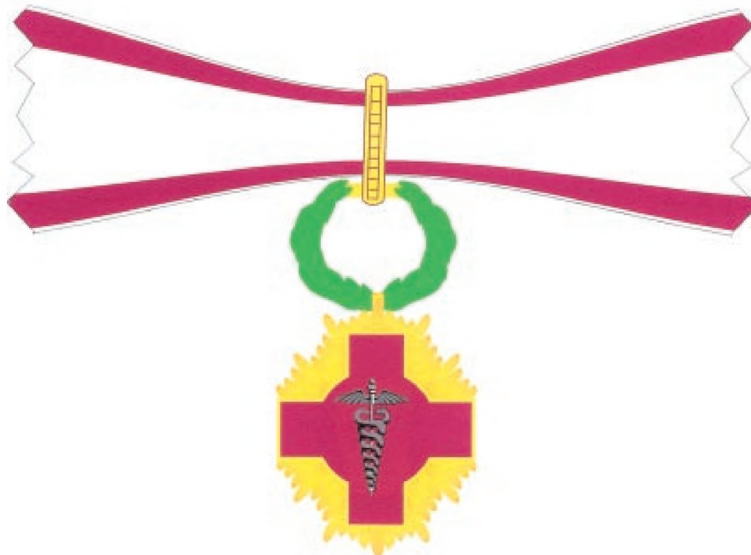
Însemnul propriu-zis al gradului de Mare Ofițer