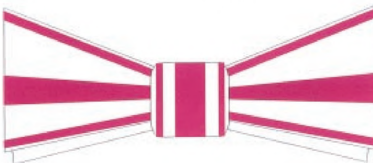
Funda pentru persoanele de sex feminin